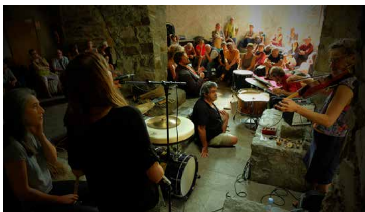
Jazz à Luz 2019 EPI Echo(s) aux Voutes