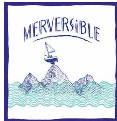
dessin © Merversible