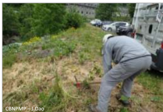
Action de coupe sous le collet

De plus, il est important de ne pas arracher les plantes autochtones afin qu'elles participent à la compétition envers les semis de Berce du Caucase.