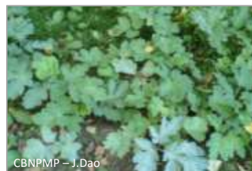
Semis de berce du Caucase

Les graines de Berce du Caucase peuvent germer jusqu'à 7 ans après leur dissémination, une intervention annuelle pendant au minimum de 7 ans est donc prévue.