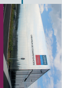
LANNE Zone Aéroports Pyrène Aéroports