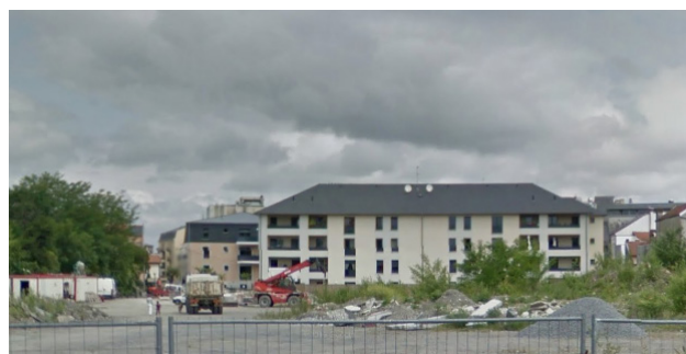
Construction d'une résidence senior à Tarbes (17 Rue Montaigne) - Chantier assuré par l'entreprise Gallego