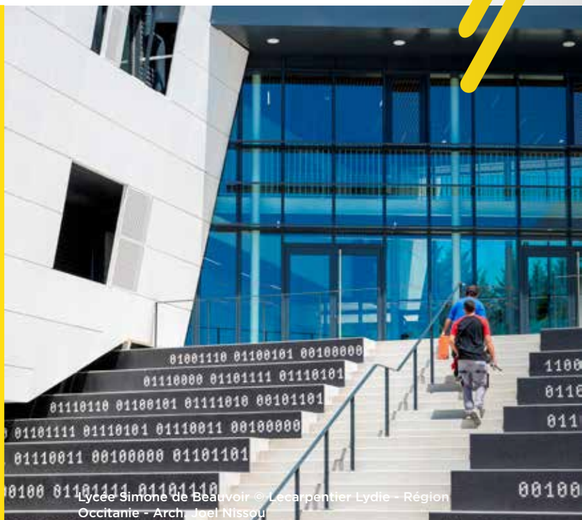
Lycée Simone de Beauvoir © Lecaarpentier Lydie - Région Occitanie - Arch. Joel Nissou

100% chauffé par géothermie et autonome en énergie grâce aux 2 400m 2 de panneaux photovoltaïques, il accueille aujourd'hui 650 élèves (1 700 élèves à terme).