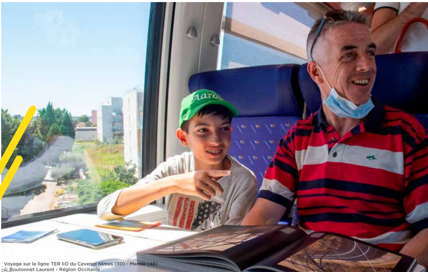
Voyage sur la ligne TER liO du Cevenol Nîmes (30) - Mende (48)

Tout au long de l'année, les jeunes de 18 à 26 ans peuvent également bénéficier de la gratuité à l'usage des trains liO grâce au programme "+=0" (Plus de 55 000 inscrits à ce jour). Le dispositif sera étendu et accessible dès 16 ans à partir de la rentrée de septembre 2023.