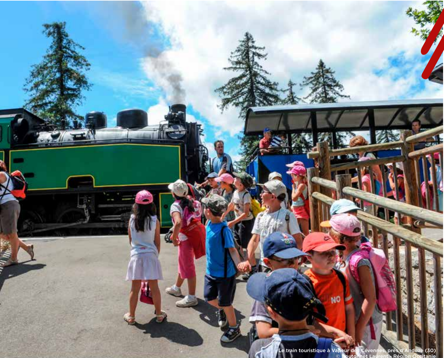
Le train touristique à Vapeur des Cévennes, près d'Anduze (30)

La Région accorde une subvention annuelle de 625 000€ pour financer cette opération sur l'ensemble du territoire, aux côtés des autres partenaires.